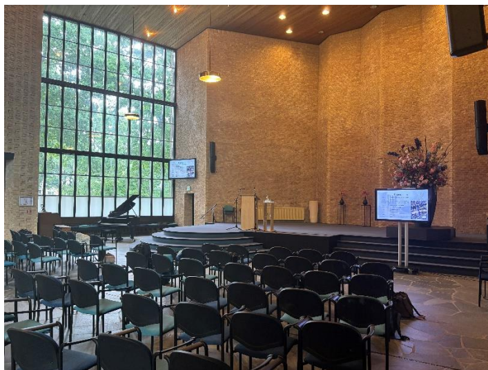
Interieur Open Hofkerk Apeldoorn