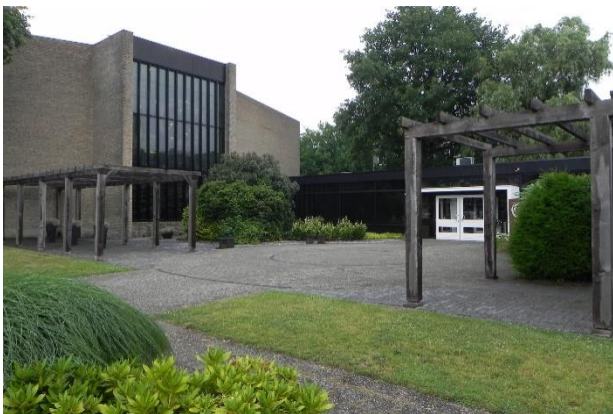
Open Hofkerk Apeldoorn

Het eerste bezoek betrof het door de Rijksdienst voor het Cultureel Erfgoed (RCE) op 26 juni jl. georganiseerde symposium 'Het platform Post-65 gebedshuizen: tussen sloop en transitie' dat plaatsvond in de voormalige Gereformeerde Open Hofkerk in Apeldoorn, in 1966 ontworpen door Zuiderhoek en inmiddels getransformeerd tot het Hof van Afscheid, een gemeentelijk monument en dus een Post-65-kerk. Het andere bezoek was aan de Petrakerk in Veenendaal, één van de eerste door Zuiderhoek ontworpen kerken, ook nu een gemeentelijk monument, maar deze valt onder de Wederopbouwkerken.