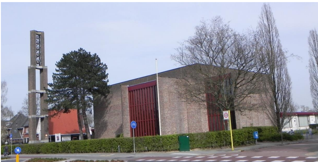
Petrakerk Veenendaal