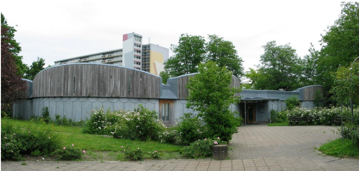
Maranathakerk Deventer; foto SBKG MON

De RCE heeft een longlist opgesteld van de Post-65-gebouwen waaronder meerdere kerken, enkele zullen de Rijksmonumentstatus krijgen in de komende jaren. Één van de kerken die daar vrijwel zeker voor in aanmerking zou moeten komen is de Maranathakerk in Deventer van de architect Aldo van Eyck in 1992. SBKG MON denkt mee over de restauratie van deze kerk; zie eerdere nieuwsbrief.