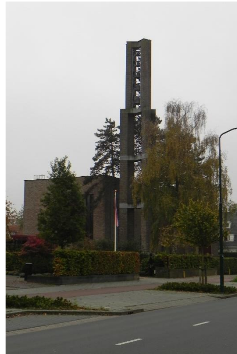
Petrakerk Veenendaal