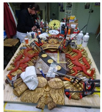
Foto: De getoonde afbeelding toont een wapenschild waar door veel houtwormaantasting de samenhang verzwakt was. Na herstel van aantasting en gebreken zal het polychroom (schilderwerk) nog gerestaureerd worden.

De natuurstenen epitafen (grafschrift) worden op dit moment hersteld.