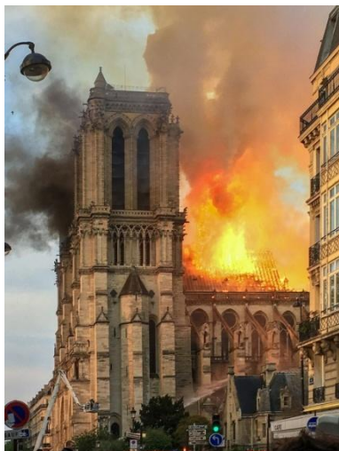
Notre-Dame Parijs