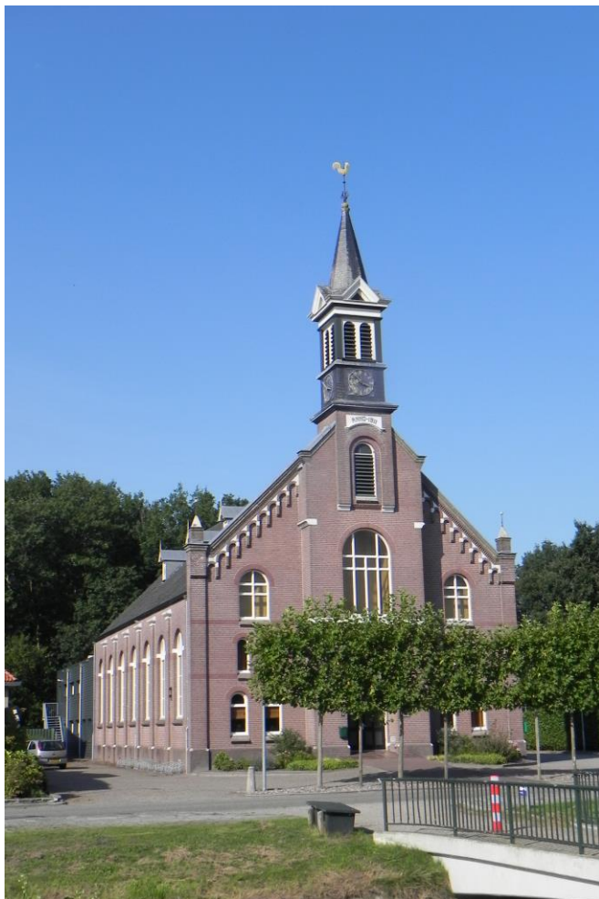
De Krim, Protestantse kerk en verenigingsgebouw 'De Horizon'

Na goedkeuring van de 3 VKB-afdelingen vindt u een beknopt financieel verslag over 2022 op onze website onder de knop ANBI.