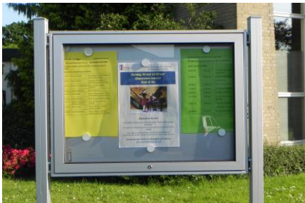
Zwolle, infobord bij De Hoofdhof

Op verzoek van het bestuur oriënteert ons bouwbureau zich m.i.v. 2021 (en zeker nu i.v.m. de oorlog in Oost-Europa op maatregelen om energie te besparen) op de advisering m.b.t. het terrein van duurzaamheid in relatie tot kerkelijke gebouwen. Naast monumentale gebouwen vestigen wij hiermee ook de aandacht op beheerders en eigenaren van kerkelijke gebouwen van meer recente datum. Mogelijk zijn in kerkelijke gemeenten ideeën, initiatieven of plannen waarin zij kijken naar de mogelijkheden om gebouwen of delen daarvan te verduurzamen. Wellicht kunnen de SBKG-MON en besturen elkaar vinden in een traject voor een pilot rond deze onderwerpen. In 2021 is een enquête gehouden over dit onderwerp.