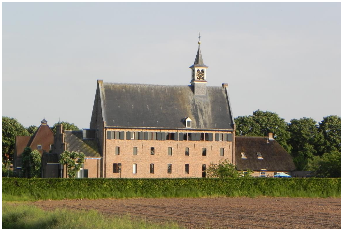
Windesheim, bakermat van de Moderne Devotie

Werkzaamheden aan deze gebouwen komen in sommige gevallen ook in aanmerking voor subsidie van de Solidariteitskas, het vangnet van de PKN-kerken, en wellicht ook van andere fondsen.