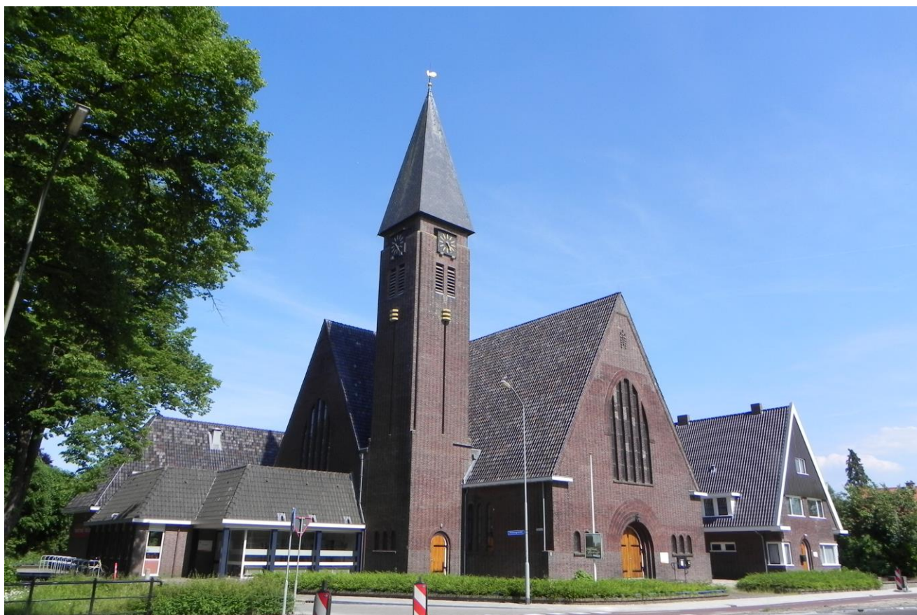
Harderwijk, Plantagekerk met voormalige pastorie en nevenruimten