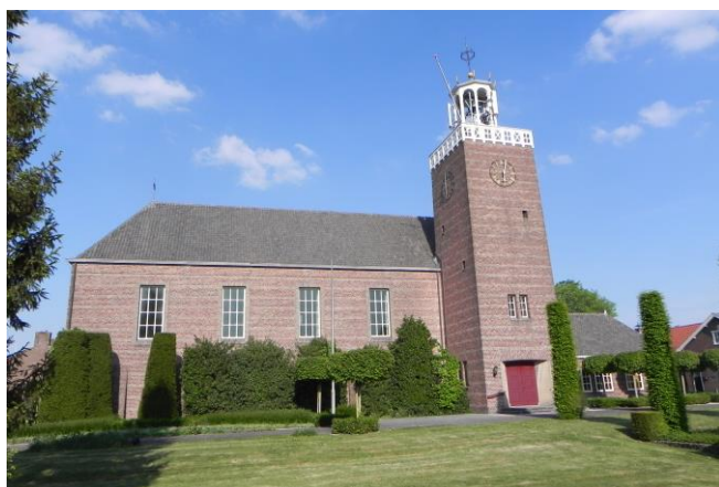
Kerkdriel, Protestantse kerk

Beide overleggen zijn als prettig en informatief ervaren en zullen periodiek worden herhaald.