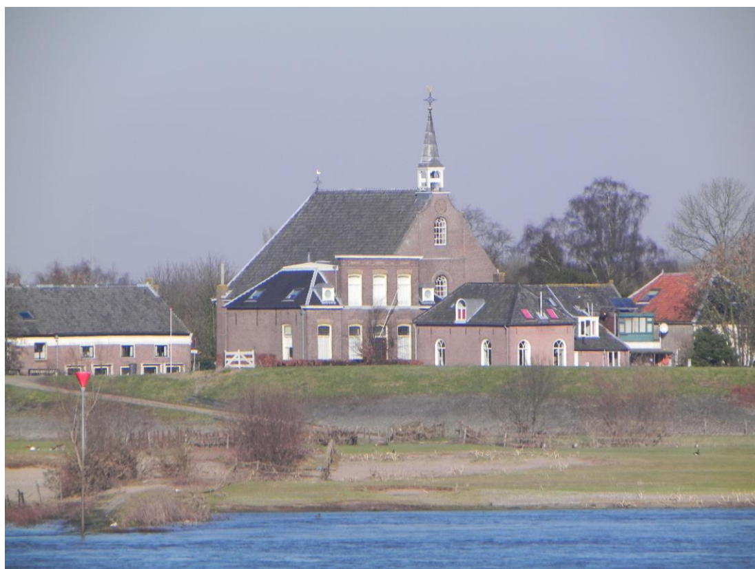
Herwijnen HG; hervormde kerk