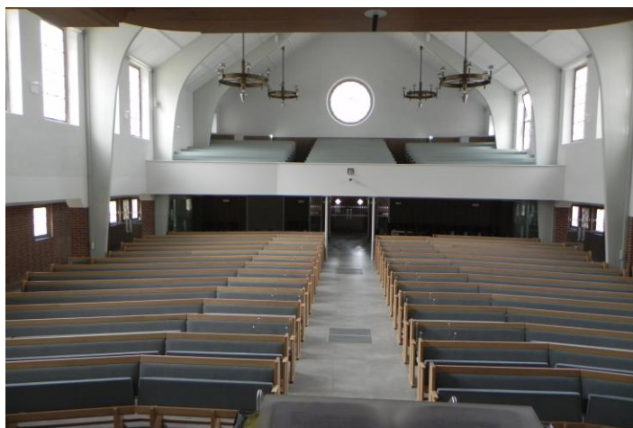
Kootwijkerbroek HG; interieur hervormde kerk

Als donateur kunt u onze stichting benaderen voor advies en inlichtingen. Graag verwelkomen wij nieuwe donateurs voor de SBKG Midden- en Oost Nederland. Het donateurschap kost € 50,00 per jaar per kerkelijke gemeente, ongeacht het aantal kerkelijke gebouwen.