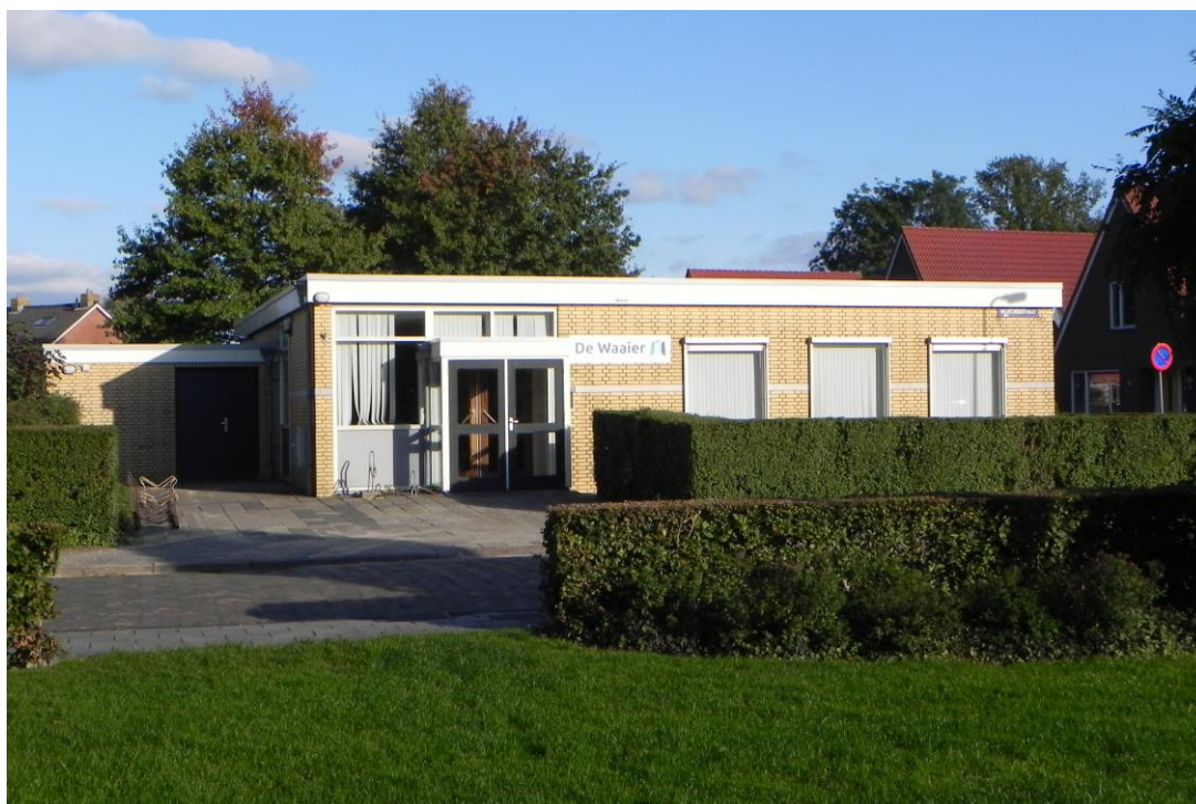
Blokzijl PG; gebouw 'De Waaier'

Inmiddels is ook bekend geworden dat de Rijksdienst voor het Cultureel Erfgoed (RCE) een subsidieregeling voorbereid met het oog op verduurzaming. Voor niet-monumentale gebouwen hebben de burgerlijke gemeenten ook een loket voor duurzaamheid en energiebeheer.