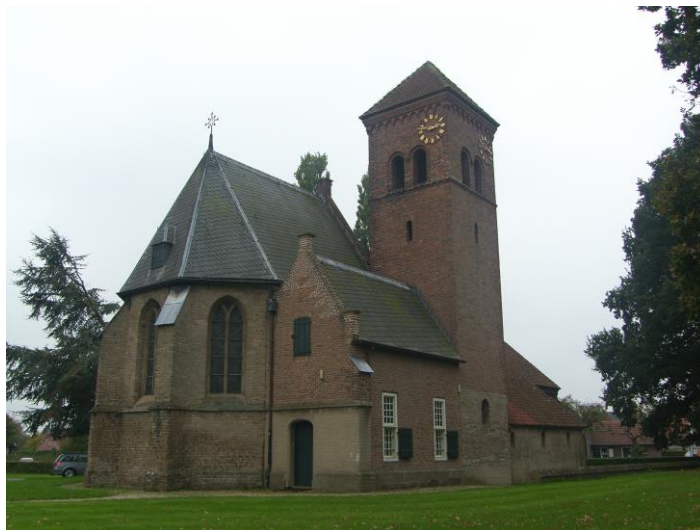
Angerlo PG; Protestantse kerk

Op verzoek van het bestuur oriënteert ons bouwbureau zich m.i.v. 2021 op advisering m.b.t. het terrein van duurzaamheid in relatie tot kerkelijke gebouwen. Naast monumentale gebouwen vestigen wij hiermee ook de aandacht op beheerders en eigenaren van kerkelijke gebouwen van meer recente datum. Mogelijk zijn er in kerkelijke gemeenten ideeën, initiatieven of plannen waarin wordt gekeken naar de mogelijkheden om gebouwen of delen daarvan te verduurzamen. Wellicht kunnen de SBKG-MON en besturen elkaar vinden in een traject voor een pilot rond deze onderwerpen. In 2021 is een enquête gehouden over dit onderwerp; op pagina 6 in dit jaarverslag treft u daarvan een samenvatting aan.