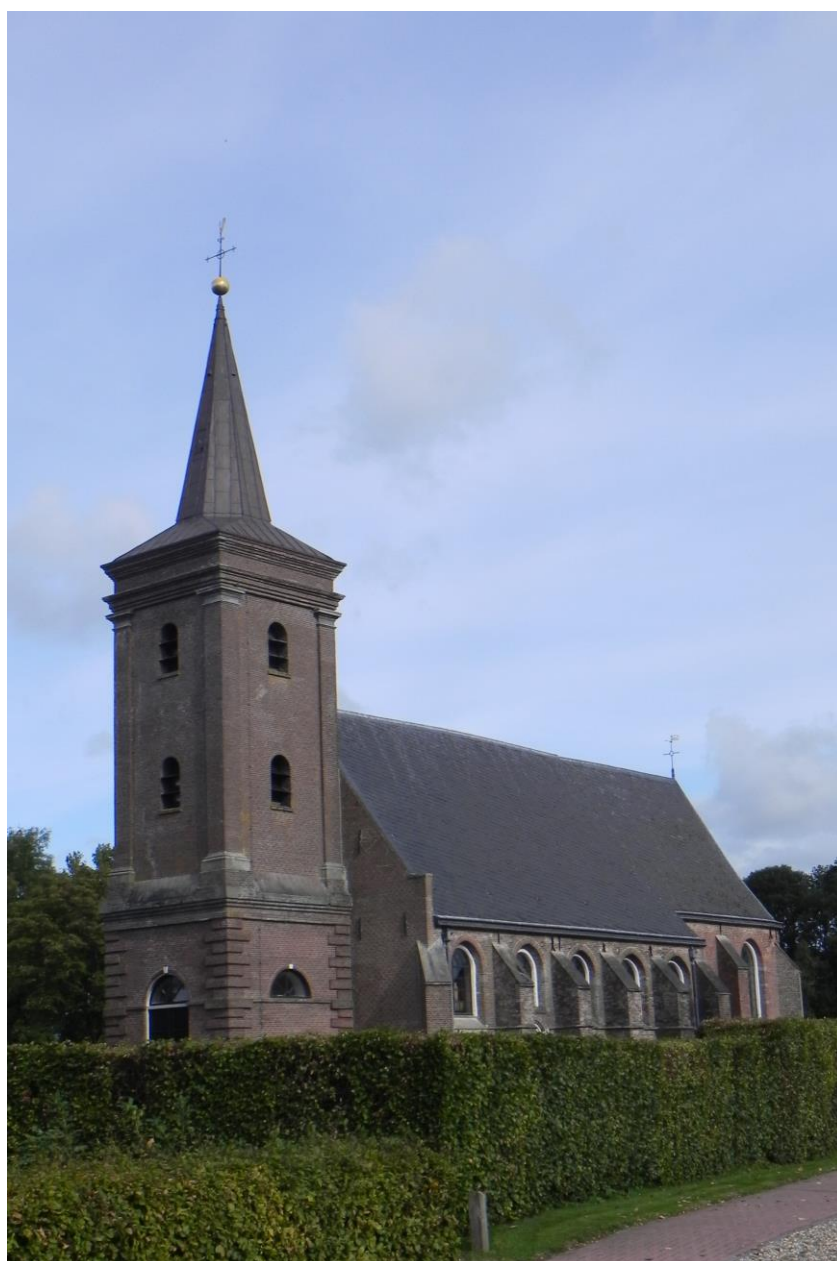
Mastenbroek HG; hervormde kerk