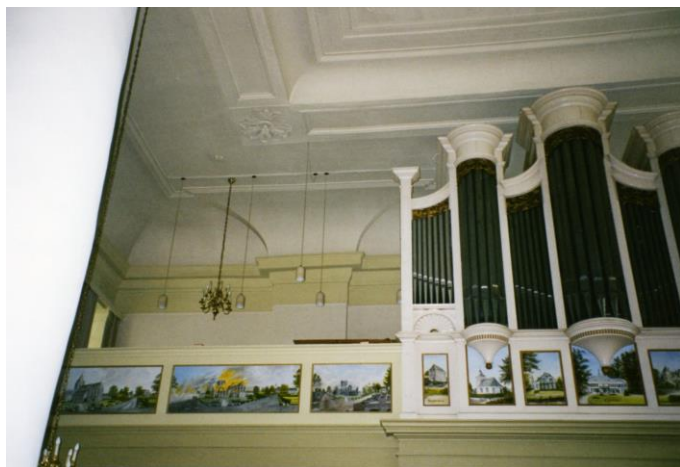
Gendringen PG; orgelbalkon met geschilderde panelen (foto 2011)

Vanwege de situatie omtrent Covid-19 zijn er in 2021 geen fysieke bijeenkomsten geweest met andere instanties. Dat is jammer omdat je dan niet in staat bent om andere bestuurders te ontmoeten.