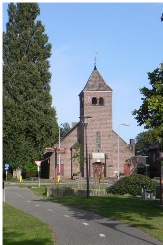
Daarle HG; hervormde kerk