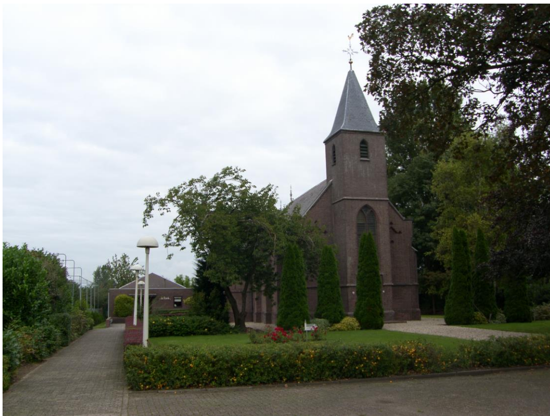
Varik PG; hervormde kerk

Werkzaamheden aan deze gebouwen komen in sommige gevallen ook in aanmerking voor subsidie van de Solidariteitskas, het vangnet van de PKN-kerken, en wellicht ook van andere fondsen.