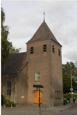
Hasselt GK; Ichtuskerk