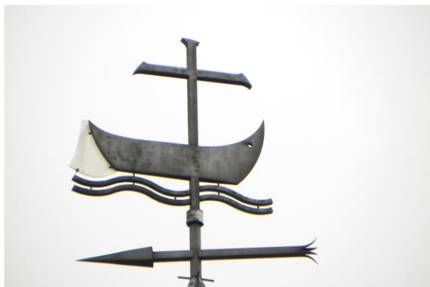
Zeewolde PG; afbeelding op de torenspits

De plaatselijke kerkelijke gemeenten hebben wel een groepsbeschikking vanuit hun landelijk kerkverband, maar moeten inmiddels aan meer voorwaarden voldoen dan voorheen willen zij van de groepsbeschikking gebruik kunnen blijven maken.