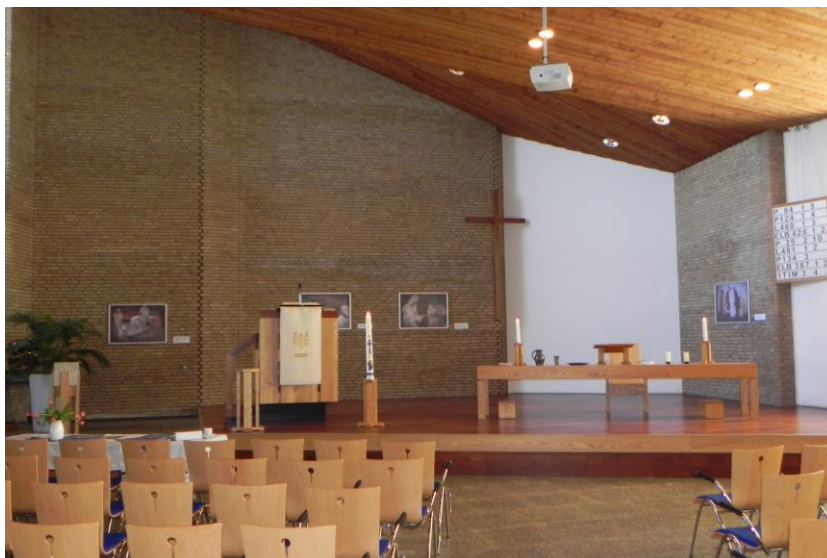
Emmeloord PG; De Ontmoeting

Aanvragen voor een gesprek lopen in principe via het bouwbureau. Van daaruit wordt beoordeeld hoe de verdere aanpak het beste kan plaatsvinden. Ook bij het secretariaat van onze stichting komen regelmatig vragen binnen die dan worden doorgegeven aan en besproken met de bouwkundigen waarna (indien gewenst) een afspraak wordt gemaakt.