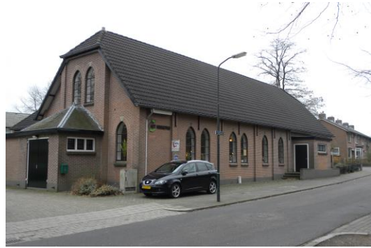
Beekbergen HG; Het Hoogepad

Onze vergaderlocatie was normaliter in één van de zalen van verenigingsgebouw 'Het Hoogepad' van de Hervormde gemeente te Beekbergen. Eén keer is uitgeweken naar het verenigingsgebouw van de hervormde gemeente Heelsum-Kievitsdel. In het verslagjaar is er helaas geen gelegenheid geweest om een vergadering op locatie te houden.