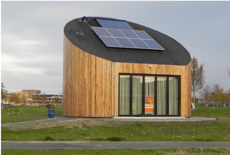
Almere PG; Pioniersplek 'De Schone Poort'

Op verzoek van het bestuur oriënteert ons bouwbureau zich m.i.v. 2021 op advisering m.b.t. het terrein van duurzaamheid i.r.t. kerkelijke gebouwen. Naast monumentale gebouwen vestigen wij hiermee ook de aandacht op beheerders en eigenaren van kerkelijke gebouwen van meer recente datum. Mogelijk zijn er in kerkelijke gemeenten ideeën, initiatieven of plannen waarin wordt gekeken naar de mogelijkheden om gebouwen of delen daarvan te verduurzamen. Wellicht kunnen de SBKG-MON en besturen elkaar vinden in een traject voor een pilot rond deze onderwerpen.