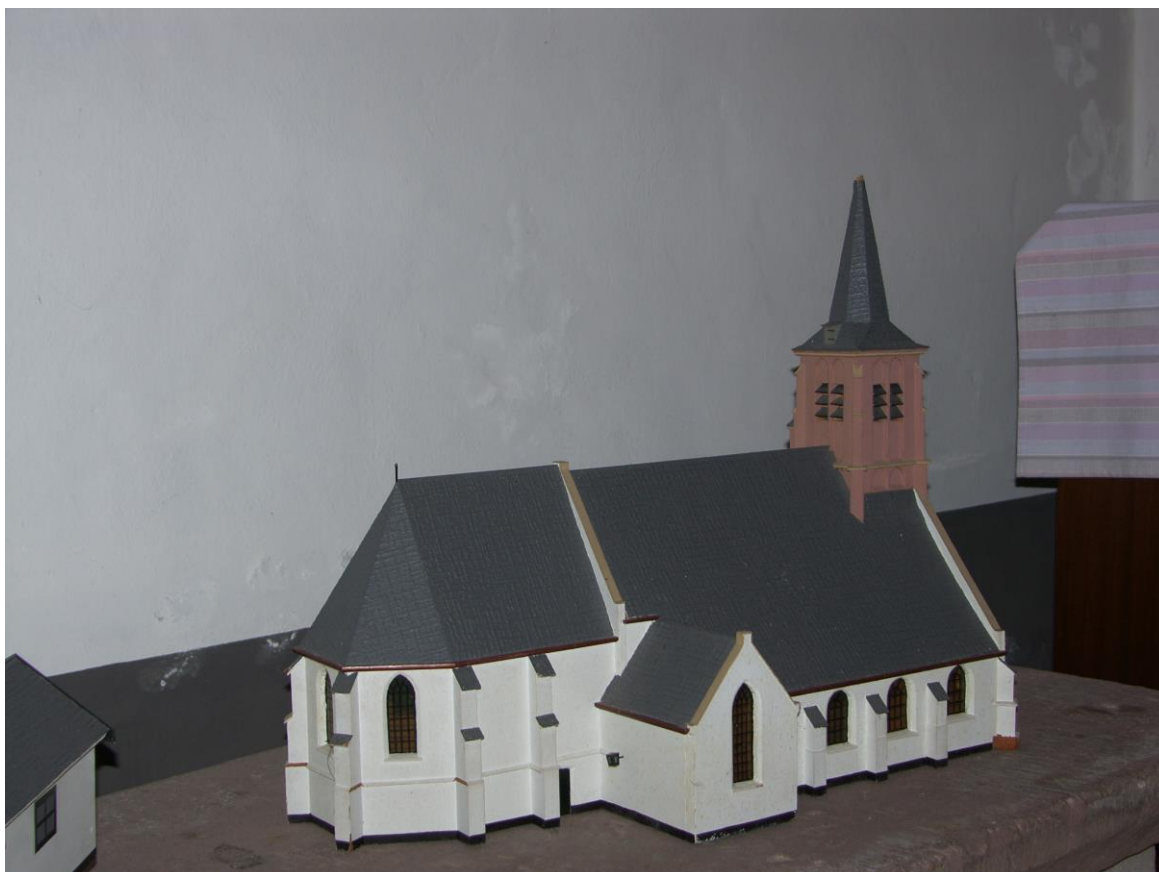
Enspijk PG; maquette

Dit betekent dat giften en schenkingen door particulieren en bedrijven aan de stichting, volgens de daarvoor geldende regels, voor hen met een opslag fiscaal aftrekbaar zijn. Ook brengt de vrijstelling mee dat de stichting in de toekomst geen schenkings- of successierecht verschuldigd is over ontvangen giften, legaten en erfenissen.