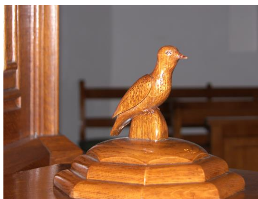
Oene HG; doopvont