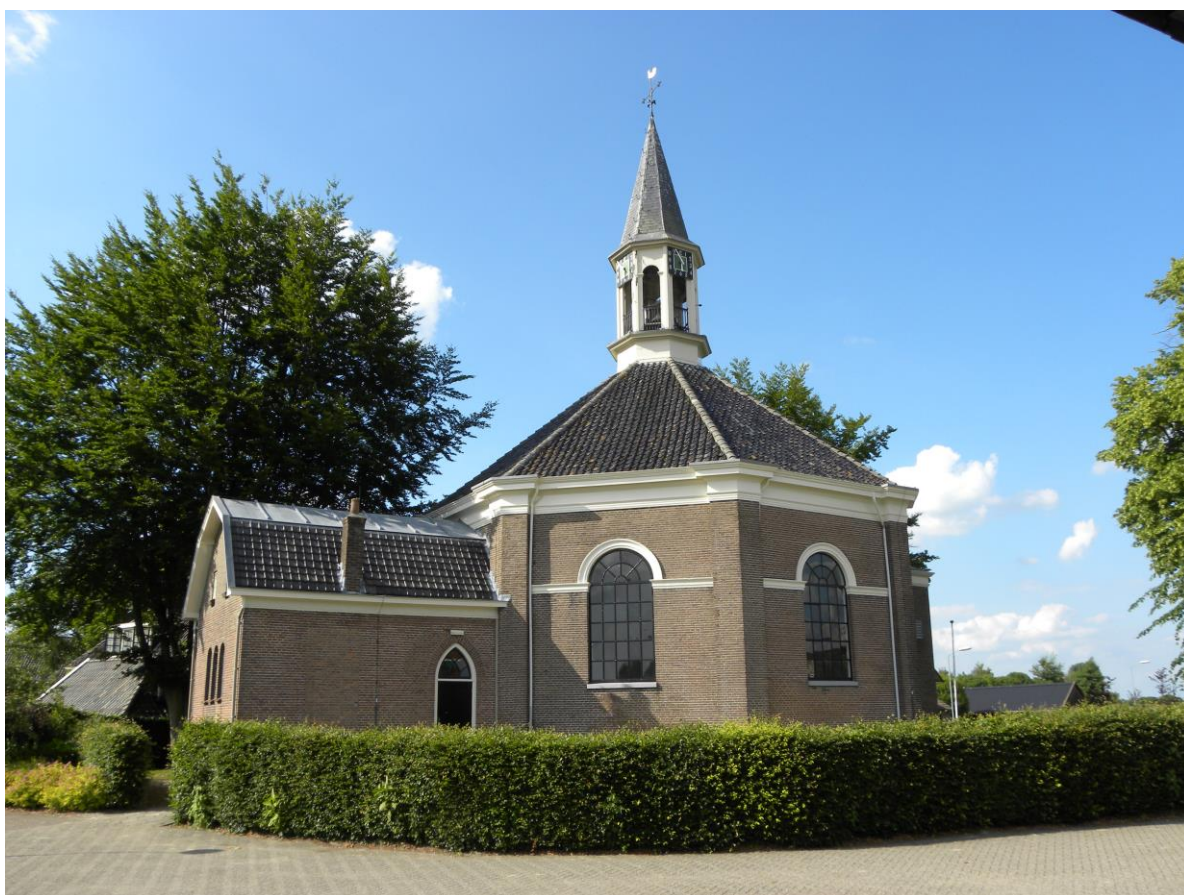
Veessen HG; Hervormde kerk