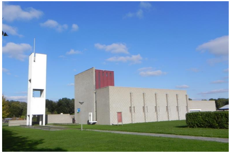
Nagele PG; kerkgebouw 'De Ruimte'

Graag wijzen wij de eigenaren van niet-monumentale kerkelijke gebouwen erop dat ook zij gebruik kunnen maken van onze bouwkundige en financiële advisering en expertise. Werkzaamheden aan deze gebouwen komen in sommige gevallen ook in aanmerking voor subsidie van de Solidariteitskas, het vangnet van de PKN-kerken, en wellicht ook van andere fondsen.